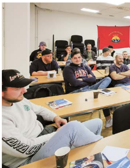
Medlemmarna, Hydralid, under utbildning i Lidköping

– Jag tror att arbetet kommer vara mer automatiserat.