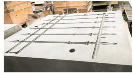
Bilden till vänster. Ingvar Wiktorsson i samtal med Torbjörn Ek.