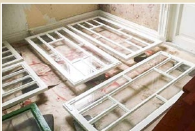
Gamla fönster kittas med linoljekitt och målas sedan med linoljefärg.