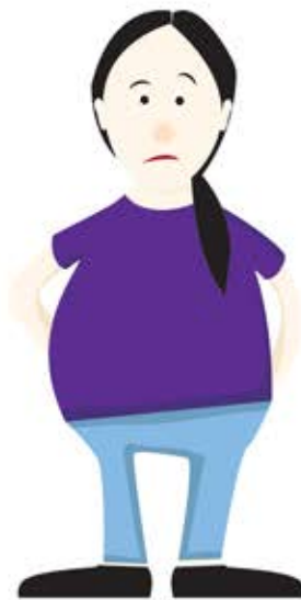
Endast medlem i a-kassan