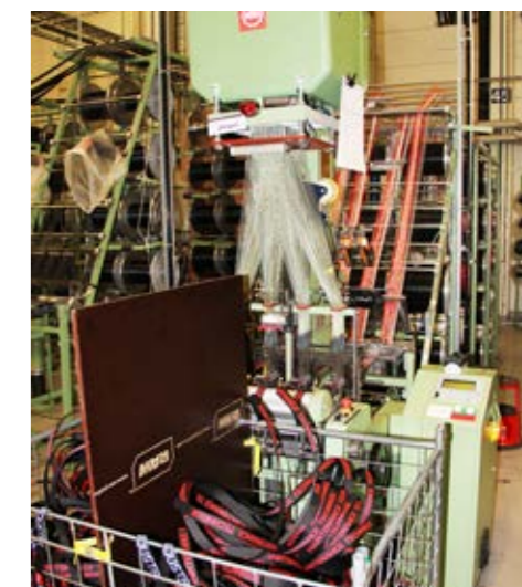
Två miljoner meter spännband tillverkades 2022!