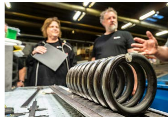
En chassifjädrar som används till fordon.