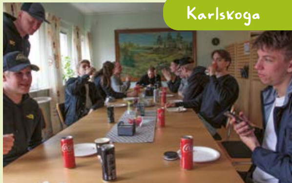
Elever från avgångsklassen på Möckengymnasiet besökte expeditionen och fick en dragning hur facket arbetar.