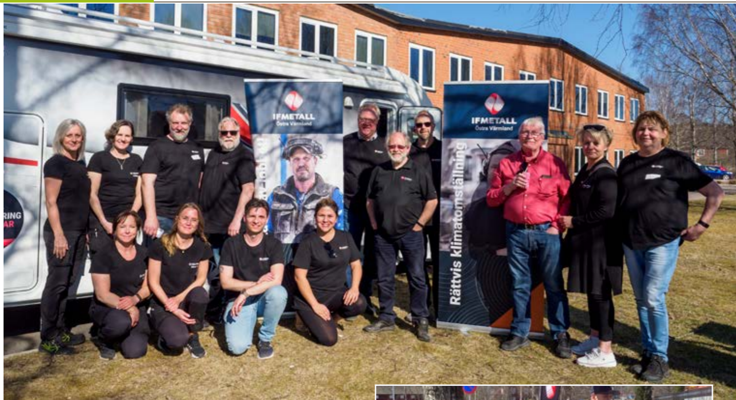
Hela gruppen som firade Exportens dag med besök på Cell Impact.

Våra företag ligger i framkant när det gäller låga utsläppsnivåer.