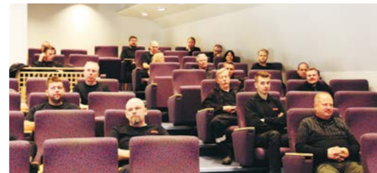
Alla medlemmar har fått genomgång av lönemodellen.