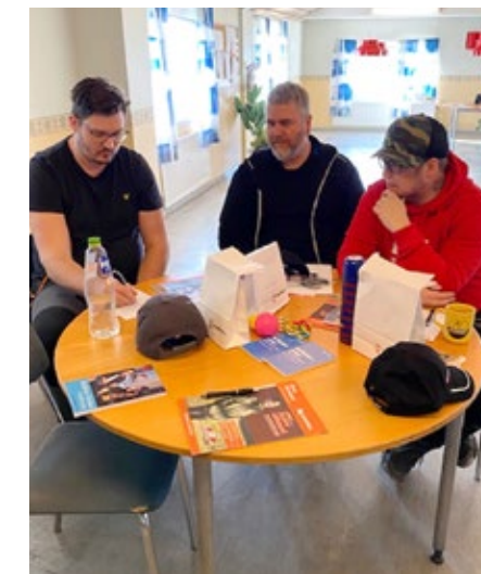
Swedcote AB efterfrågade utbildning för sina anställda. På bilderna pågår grupparbete.