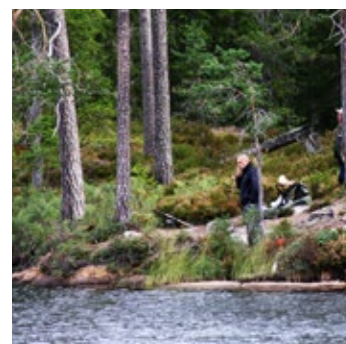
Vy från Fräkentjärn.