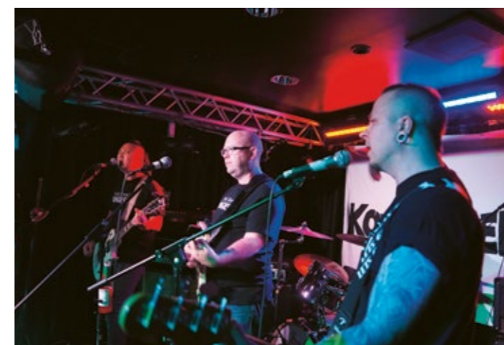
Bandet Kongressen på spelning på Rockbar i Karlstad.