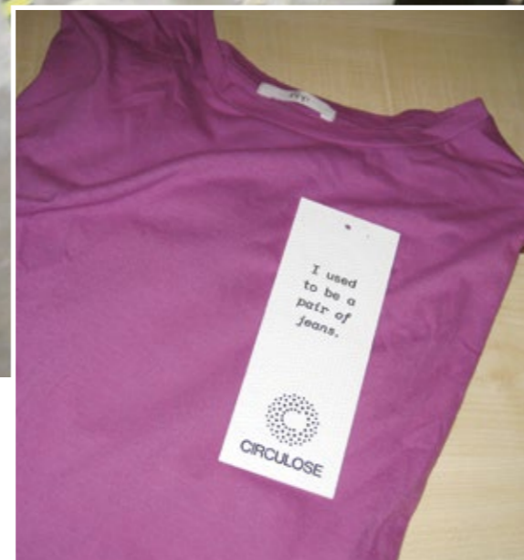
Första plagget med återvunnen bomullsfiber 2019.