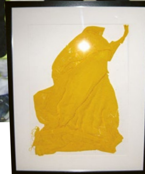
Första prototypen, Gula klänningen som kom 2014.