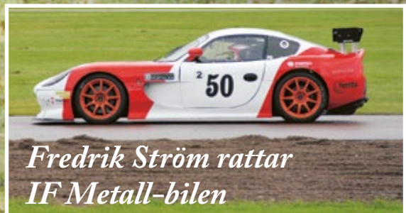
Fredrik Ström rattar IF Metall-bilen