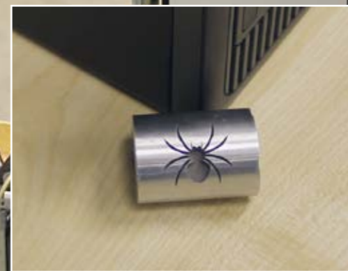
En provbit som är körd i maskinen med lasergravyr.