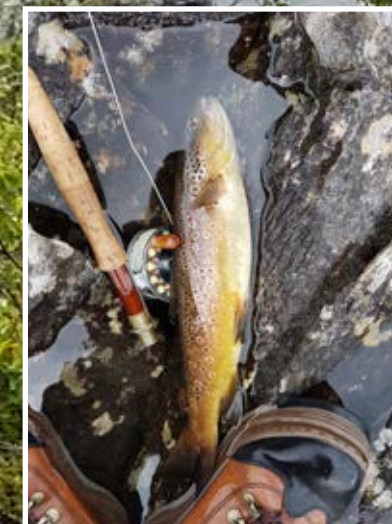
Fjällöring är Åkes favoritfisk.