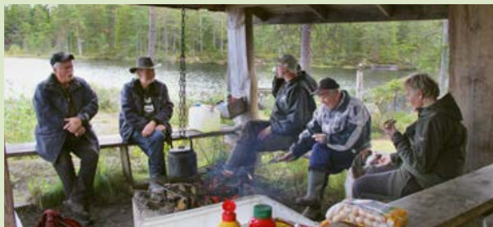
Fikapaus. En kopp kaffe och en korv smakar så bra utomhus.