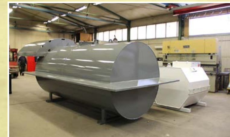
Tankar för leverans. De små vita tankarna ska hyras ut till Svenska Rallyt.