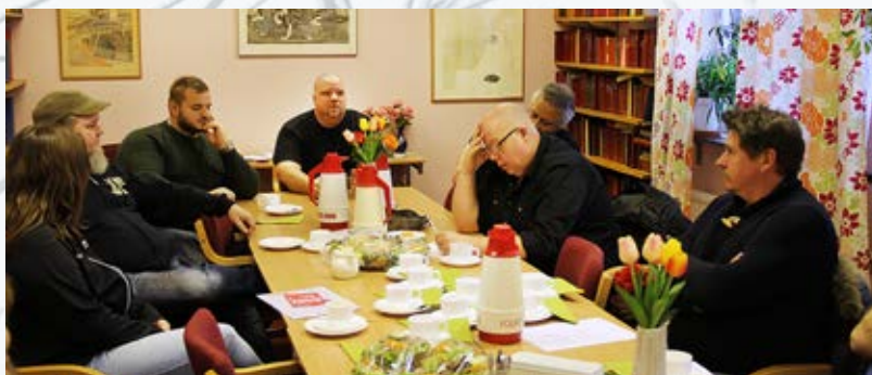
Scana Steel Björneborg