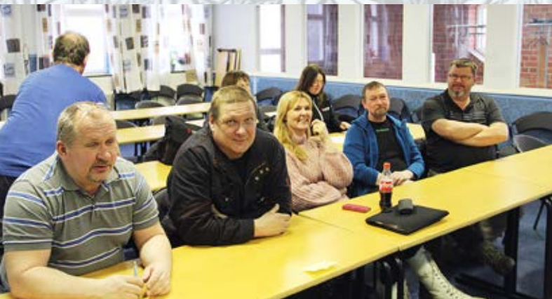
Bharat Forge Kilsta