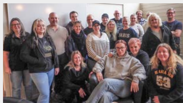
Studieverksamheten har genomfört 15 olika kurser under året och här är deltagarna från jämställdhetsutbildningen.