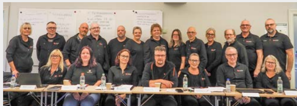
Hela avdelningsstyrelsen och personal planerar och genomför mycket av det som gjordes under 2025.