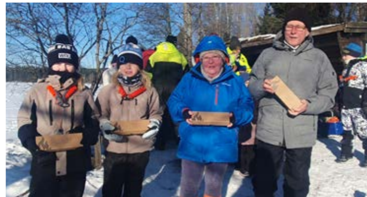
Här är alla vinnare i fisketävlingen.