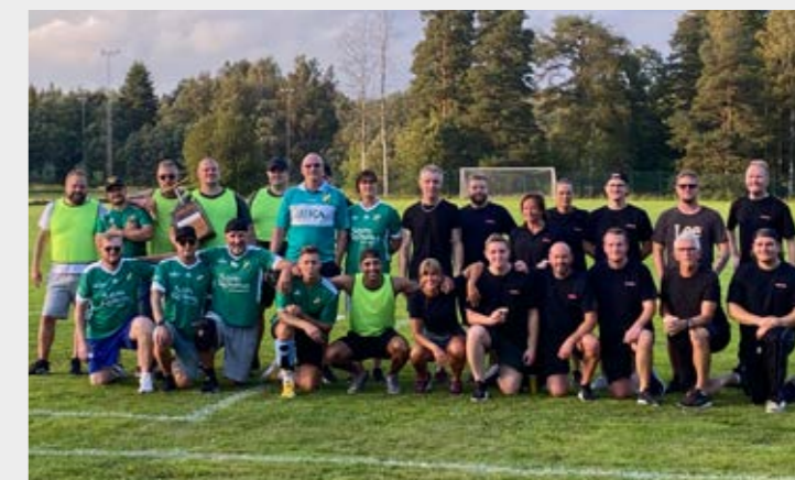
I augusti drabbas medlemmarna på BAE och Bharat Kilsta samman i en brännbollsturnering. Andra klubbar är välkomna att delta.