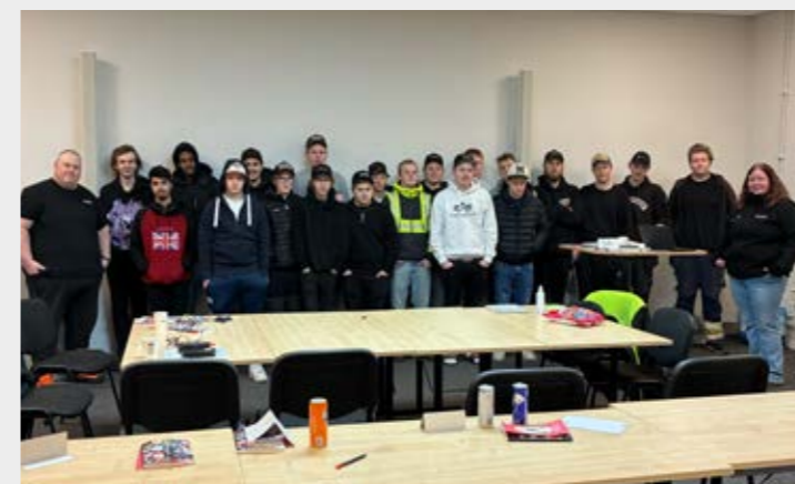
På självaste nyårsafton körde ungdomsverksamheten medlemsutbildning i Hällefors för eleverna på Rinman Educaion. Det är verksamhet ända in i kaklet.