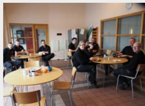
Här är medlemmarna på RZ Ölme mekaniska i Kristinehamn där tidningen gjorde företagsreportage i deras nyinflyttade lokaler.