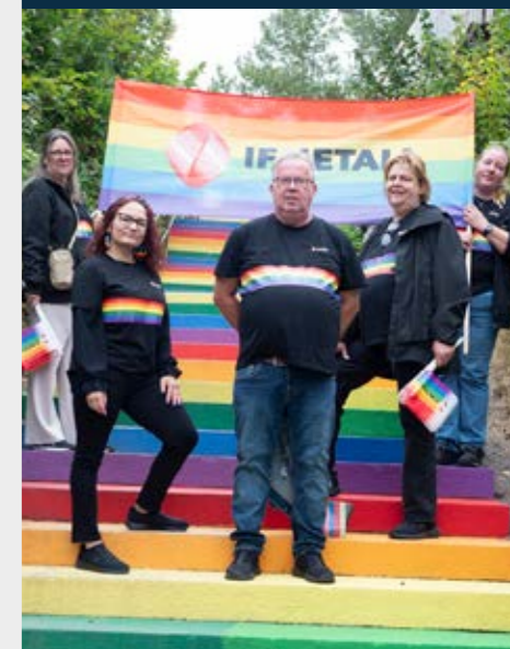
Pride Paraden i Karlskoga är populär och Östra Värmland var med under devisen "Rätten att vara sig själv på jobbet".