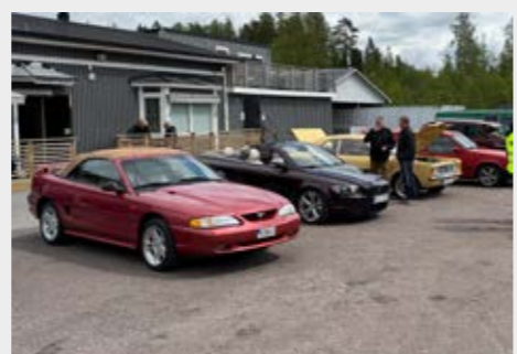
Alla bilentusiaster deltog på PokerRun i maj och kollade vem som fick bästa korten. Efteråt samlades ekipagen på Däckservice i Degerfors.