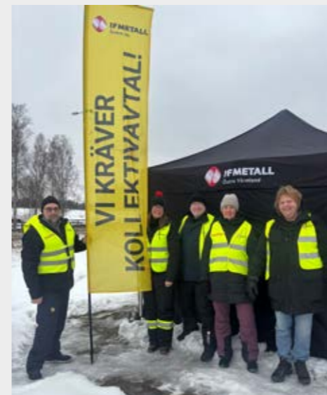
Konflikten på TM Sweden, Tesla, fortsätter. Den har pågått i två och ett halvt år. Rättvisa villkor för medlemmarna är viktigt och facken inom LO-familjen hjälper till med stridsåtgärder.