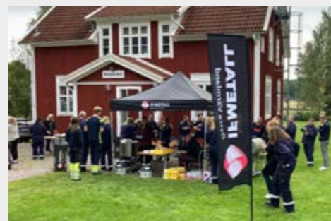
Klubbarna på industriområdet Björkborn i Karlskoga bjöd in medlemmar till korvfest. Klubbarna har arbetat med utvecklingsprojekt under året och vuxit i antalet medlemmar.