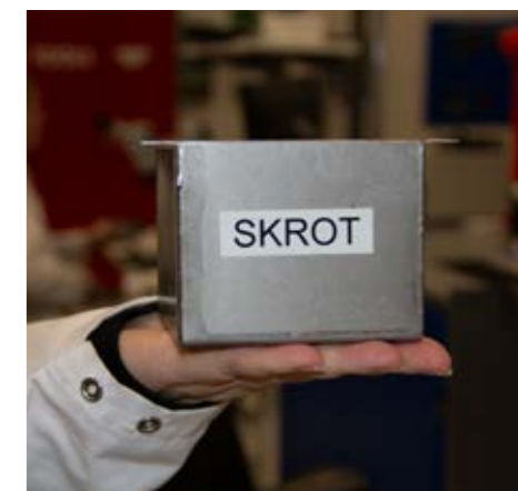
Den lilla skrotlådan som sällan behöver tömmas.