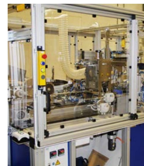
Med den nyinstallerade roboten har företaget möjlighet att bredda sitt sortiment.