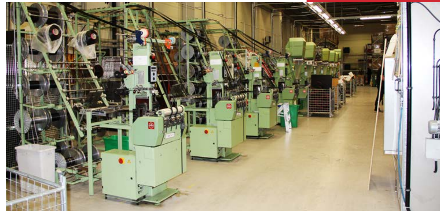
Imponerande maskinpark hos Arno-Remmen i Kristinehamn.