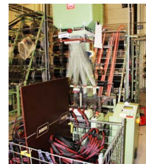
Två miljoner meter spännband tillverkades 2022!