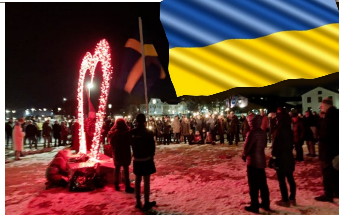
Söndag den 27/2 gick kristinehamnarna ut i manifestation för stöd och solidaritet för den ukrainska befolkningen.