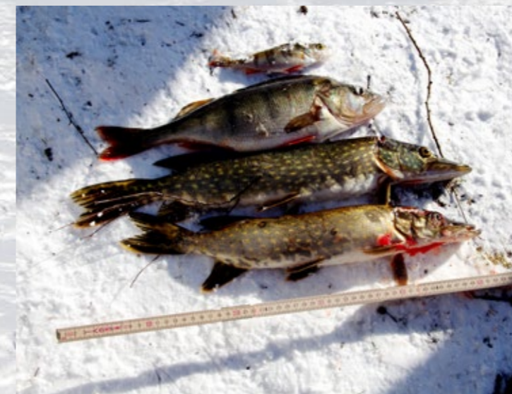
Det fanns gott om fisk för de som hade rätt bete på pilken.