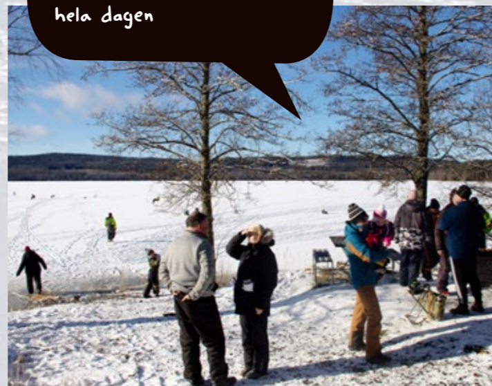
Solen sken ikapp med pimpelsugna medlemmar. Det var ett stort stim fiskare vid brasan under hela dagen.