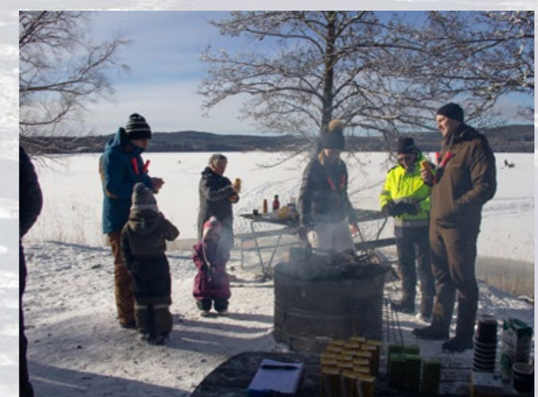
Korv och Festis smakar som allra bäst utomhus vid en brasa. IF Metalls fritidsverksamhet hade servering vid Immens is.