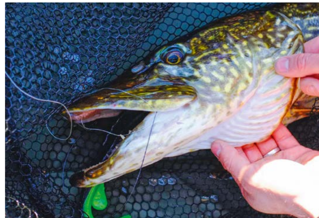
En av många gäddor som fångats!

Namn: Fredrik Uhr Ålder: 33 Familj: Singel Fritid: Fiske, frisk luft och dålig film. Mat och dryck: Vatten och mexikansk mat Jobbar: Laxå Special Vehicles AB