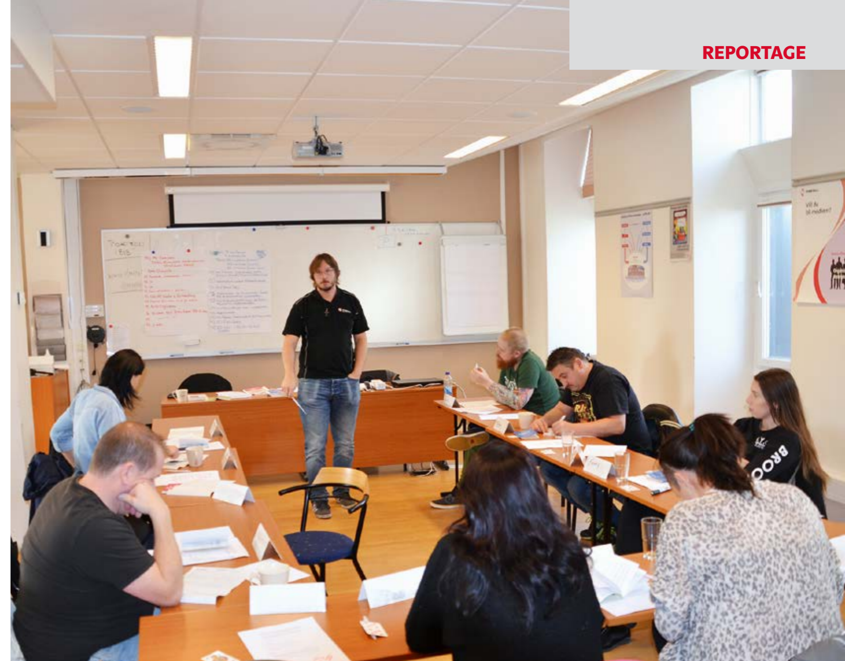
Kurserna körs så långt det är möjligt i våra egna lokaler.