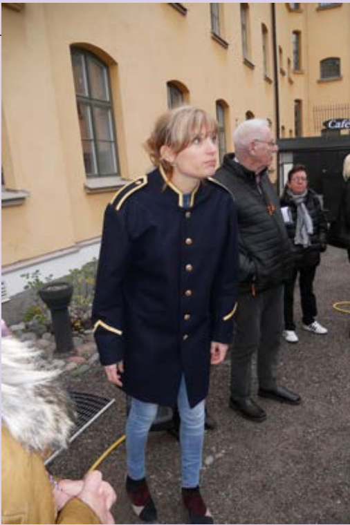
Engagerad guide på Långholmen.