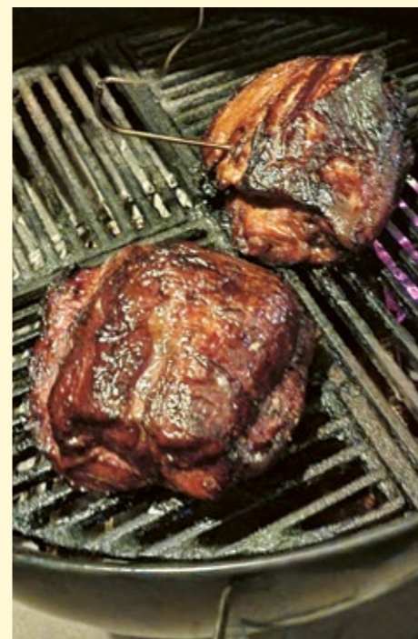
Ett av vår krönikör Claes Davidssons favoritintressen är att grilla.

Efter att vintern var på ett kort besök är det återigen ett klassiskt novemberväder med få plusgrader och regn å rusk.