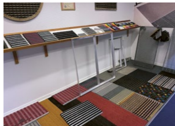
På företaget finns en utställningsdel, där man kan se ett stort upplöck av alla produkter.