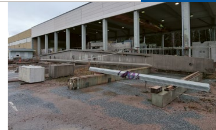
En av de takstolar som görs på fabriken.