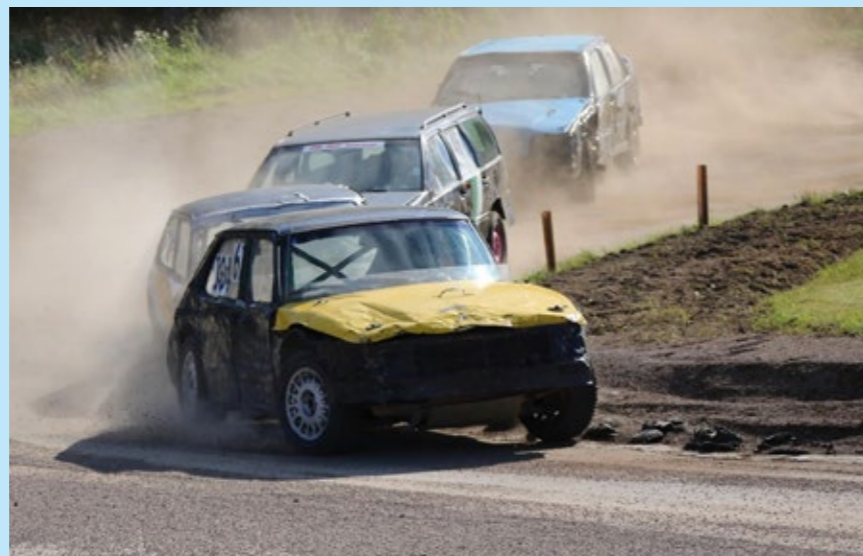
Ida sitter bakom ratten och kör för allt hon är värd!

Text: Jennie Nylund och Jan-Olov Carlsson