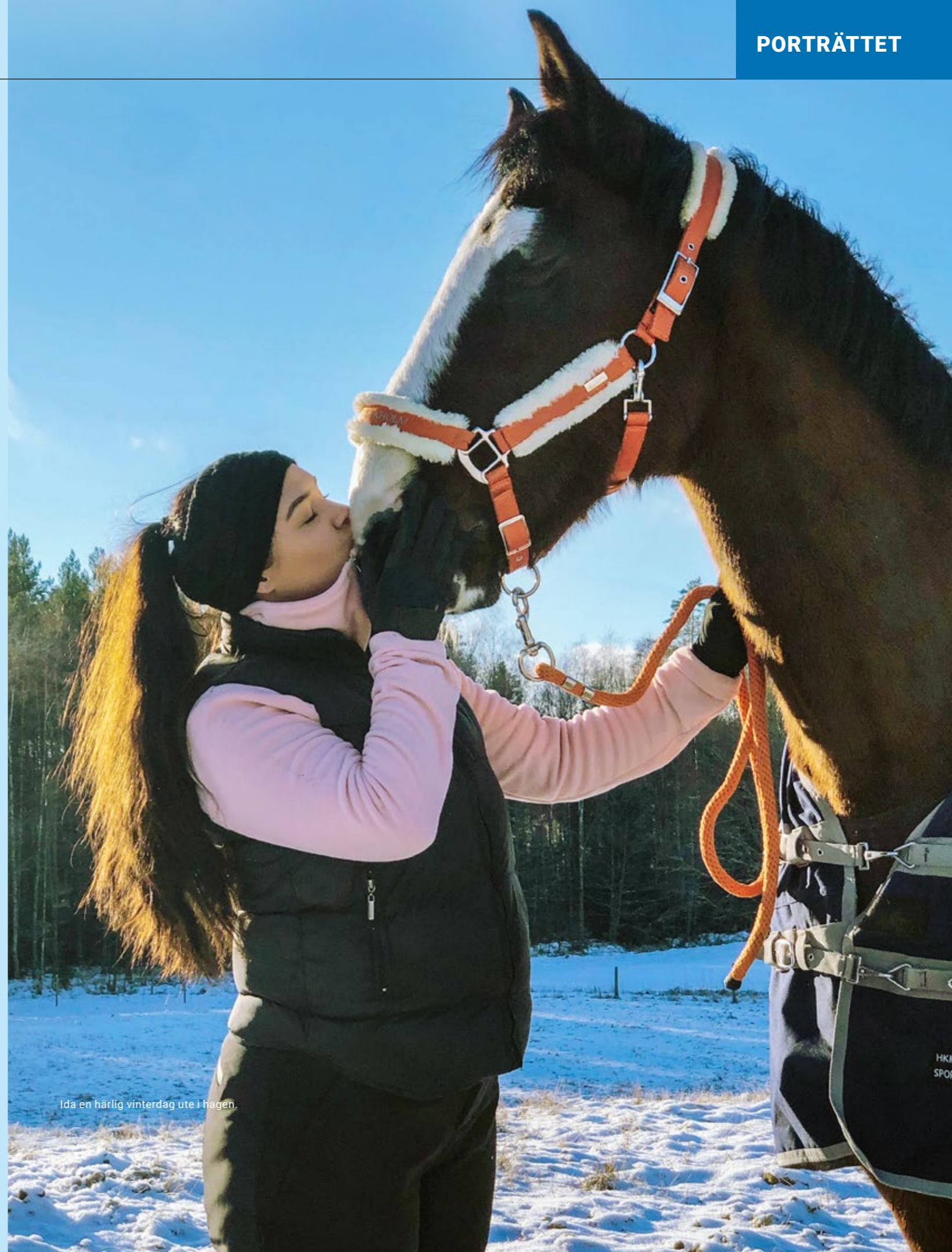
Ida en härlig vinterdag ute i hagen.