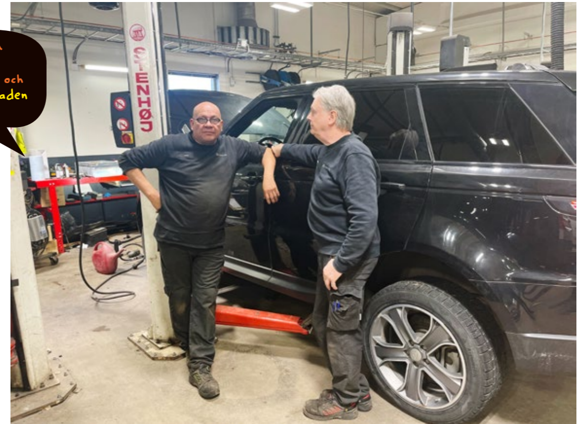
Man försöker att starta upp en verkstadsklubb igen och kontakt med avdelningen har tagits angående detta.