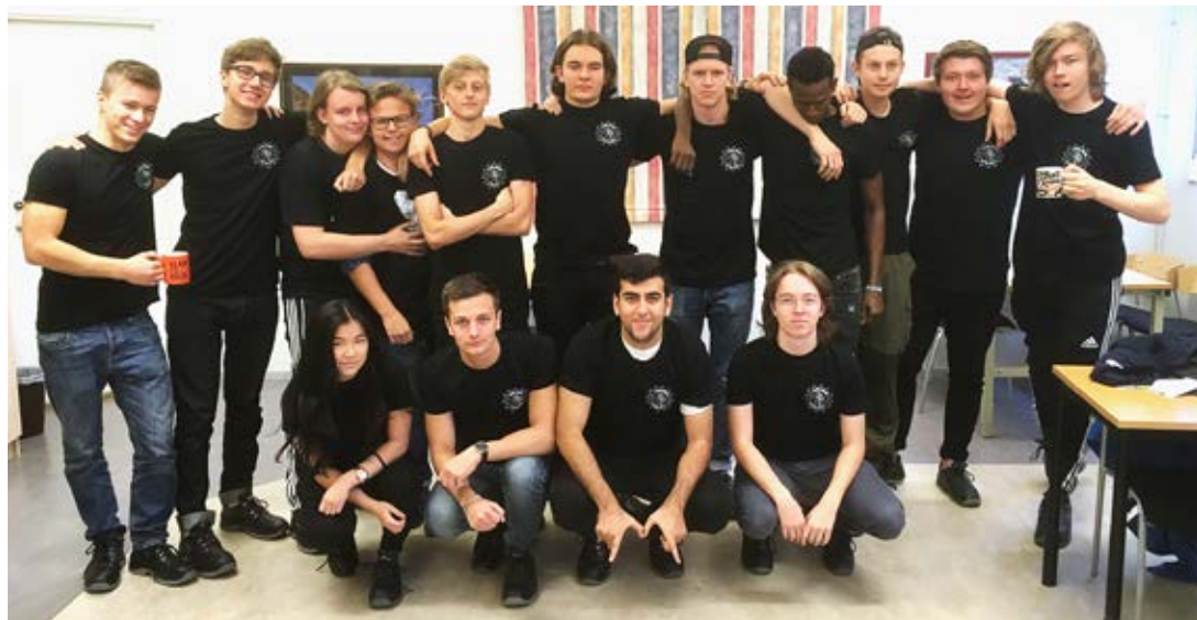
Ett gäng glada elever efter en skolinformation på Tullängskolan.

Aktiviteter är allt från Boda Borg, Liseberg, julbord på Gustavsvik till temadagar som kan handla om t.ex. rasism. Vissa aktiviteter väljer vi att lägga på helger medan andra är under