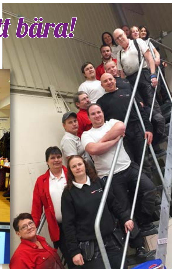
Medlemsmöte på Nolato Silikonteknik i Hallsberg. En ny klubb bildades!