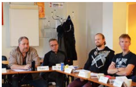
Intresserade deltagare på Agerakursen.