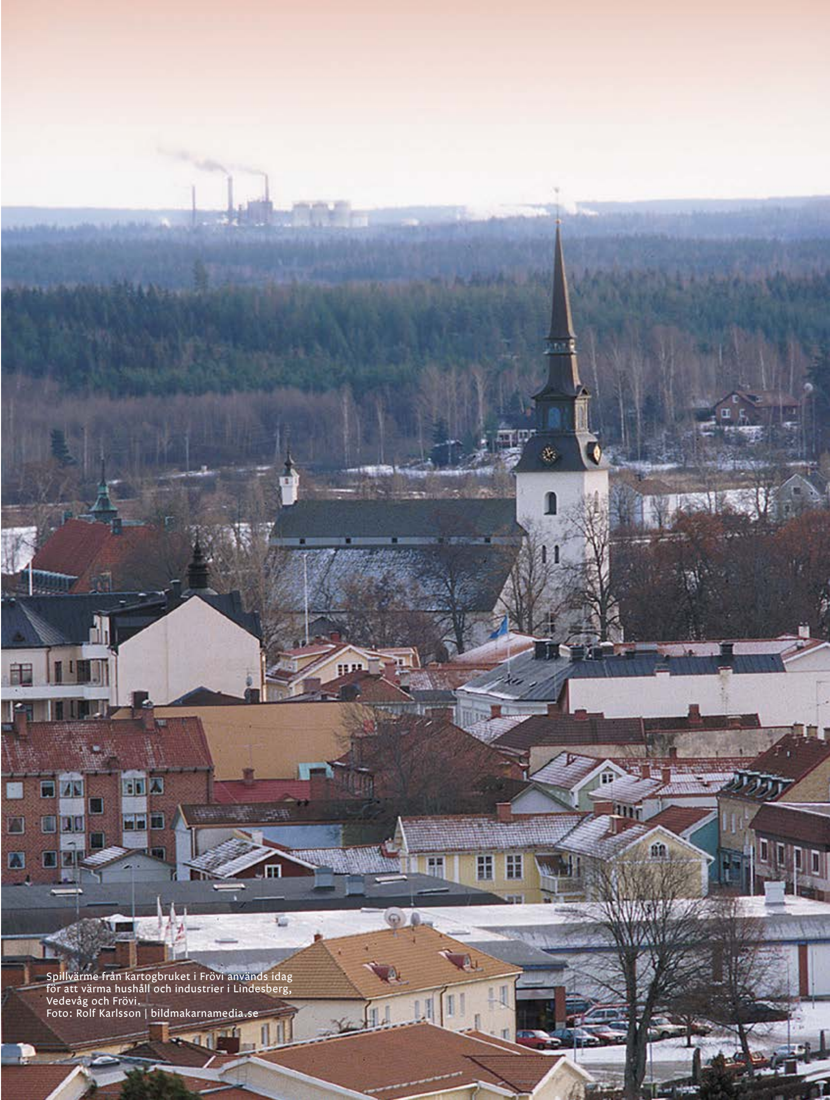
Spillvärme från kartogbruket i Frövi används idag för att värma hushåll och industrier i Lindesberg, Vedeväg och Frövi.