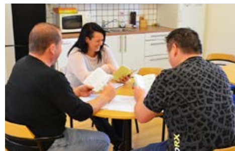
Glada miner när det bläddras i kollektivavtalet.

Medlemsförmån. Passa på! Du som är medlem i IF Metall Örebro län: