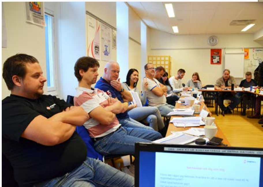
Medlemmar ifrån hela länet lyssnar under ett föreläsningsspass på kursen Agera. Kursen Agera handlar om att få grundläggande kunskaper om IF Metall som arbetsorganisation, arbetarrörelsens värderingar, främlingsfientlighet och arbetsrätt.

Bildsvep från några av våra kurser - och en ny klubb!