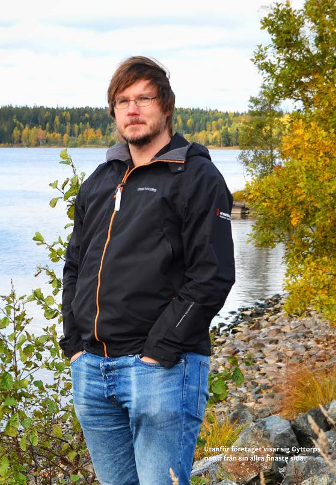
Utanför företaget visar sig Gyttorps natur från sin allra finaste sida.