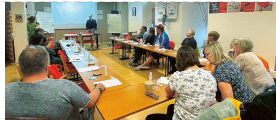
Hela gänget som lyssnar och tar in och får det mer klart för sig hur allt ska göras och i vilken ordning när man väl går i pension.