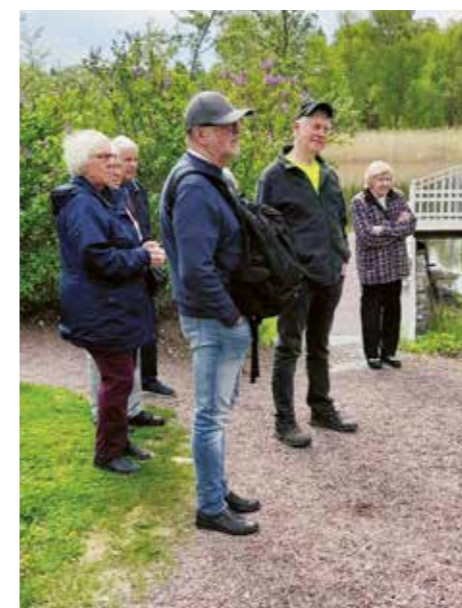
Ett samlat gäng under den guideade turen.

Det togs även upp om efterlevandeskydd och under hur lång tid man ska ta ut sin pension - fem år, tio år eller kanske livet ut.