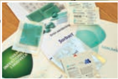
Lite av ABIGOS sortiment för sårvård. Produkterna används exempelvis vid brännskador, undertrycksbehandling, svampinfektioner och förebyggande behandlingar