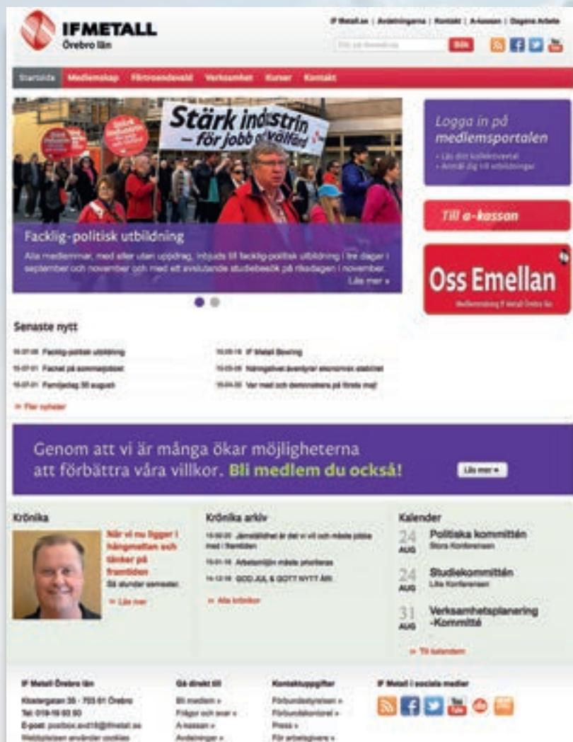
Avdelningen har en egen hemsida med adressen www.ifmetall.se/avd18