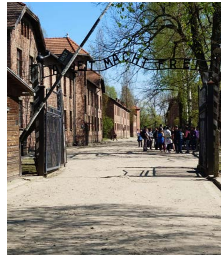
"Arbeit macht frei", tyska för "Arbete gör dig fri". Denna text finns vid ingången till Auschwitz.