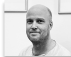
Fredrik Strid Zinkgruvan mining AB