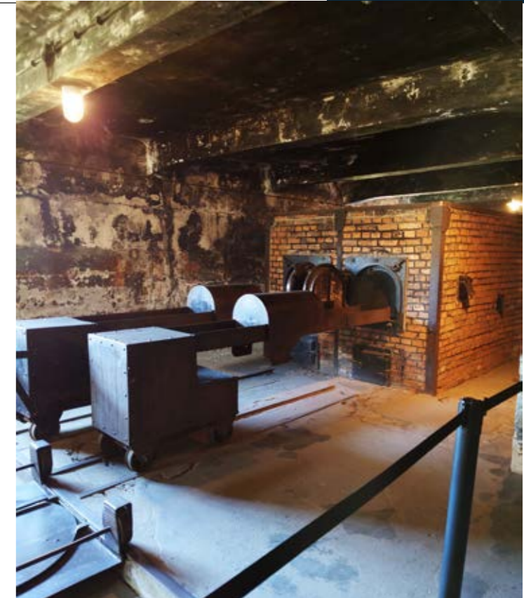
En krematorieugn som användes för att bränna upp kvarlevorna i i Auschwitz.