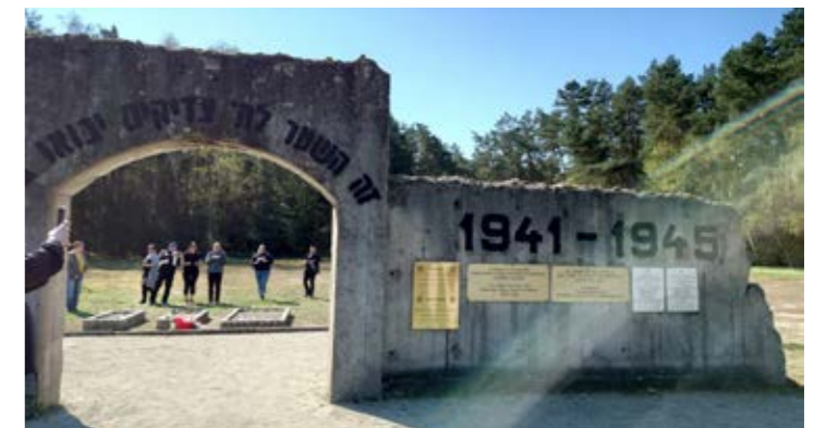
Bakom denna minnessten i Chelmno finns stora massgravar.