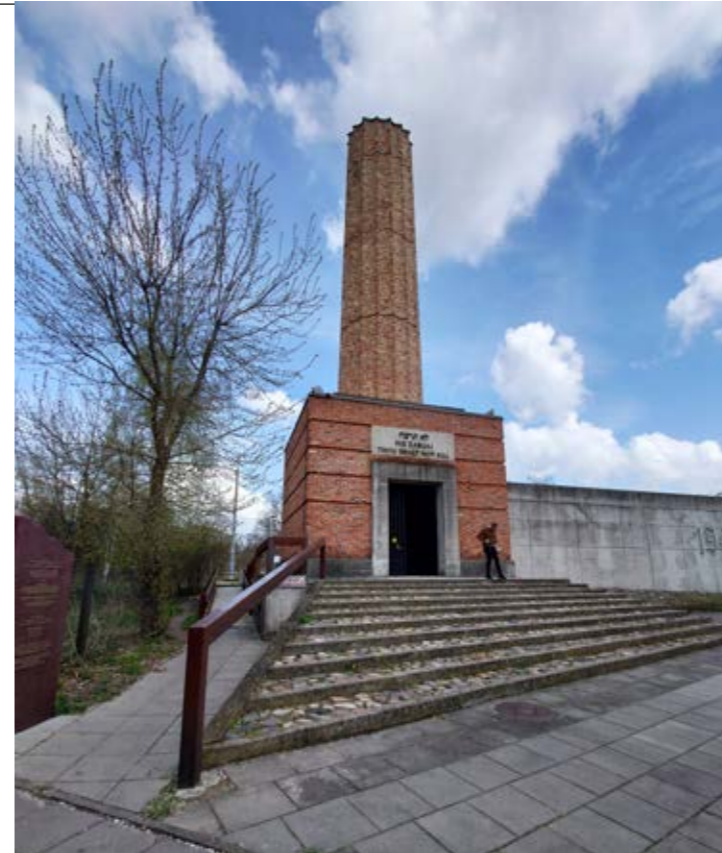
Förintelsemonument i Radugast eller som tyskarna sa Radugast umschlagplatz.