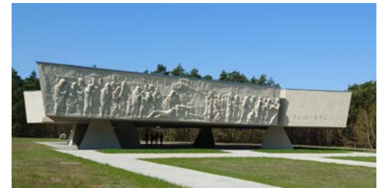
Mounument i Chelmno med orden "Pamietamy" som är polska och betyder "Vi minns".