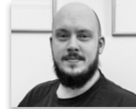
Ola Vretlund Cummins Meritor