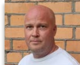
Fredrik Strid Zinkgruvan mining AB