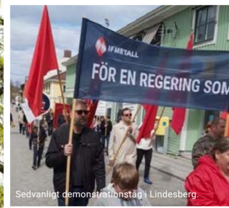
Sedvanligt demonstrationståg i Lindesberg.