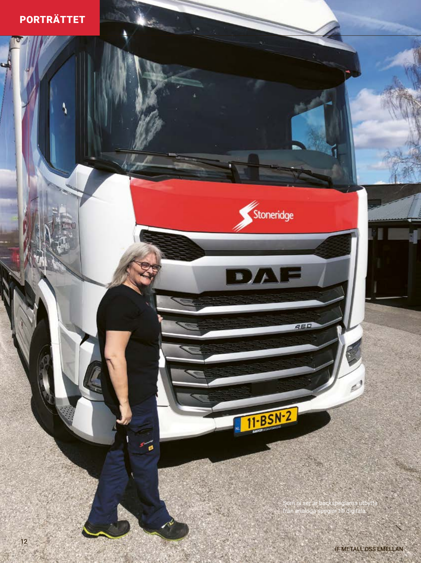
Som ni ser är backspeglarna utbytta från analoga speglar till digitala.