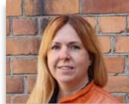
Inga Vintervärn Volvo CE