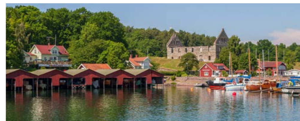
Hamnen på Visingsö i Vättern.