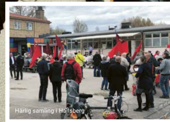
Härlig samling i Hallsberg