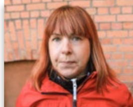
Inga Vintervärn Volvo CE