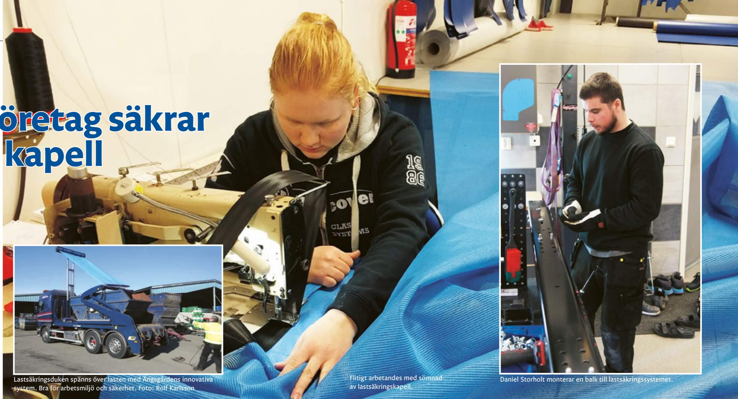
Flitigt arbetandes med sömnad av lastsäkringskapell.