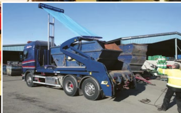
Lastsäkringsduken spänns över lasten med Ängsgårdens innovativa system. Bra för arbetsmiljö och säkerhet.