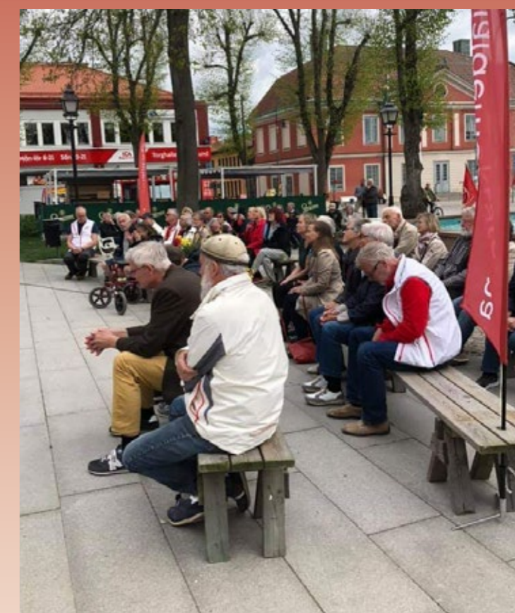
Många lyssnade på årets olika talare i Askersund.