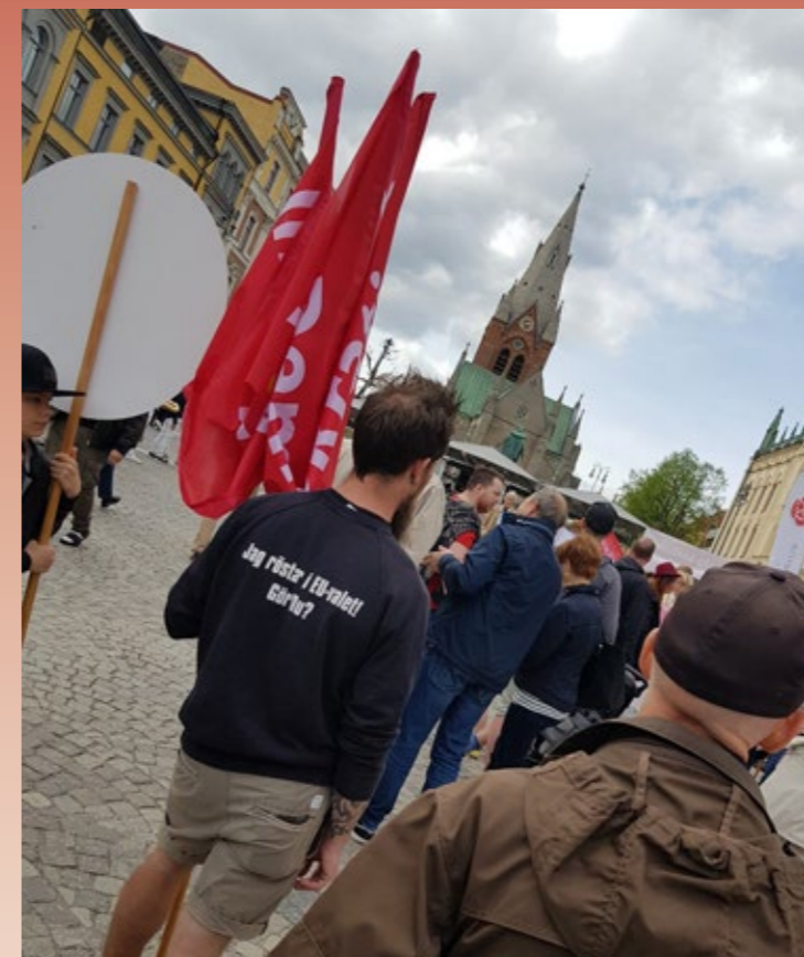
IF Metall stod beredda att gå i Örebro's första maj tåg.