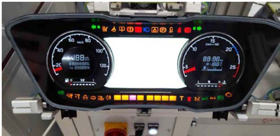
En av alla instrumenpaneler som tillverkats i fabriken.