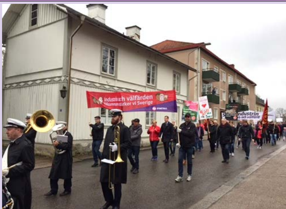
Många ville gå med i årets 1 maj tåg i Lindesberg

Glöm inte att rösta i valet den 9 september 2018 då din röst har betydelse, dessutom är det ytterligare en möjlighet att påverka hur din vardag kommer se ut och vad den kommer att innehålla.