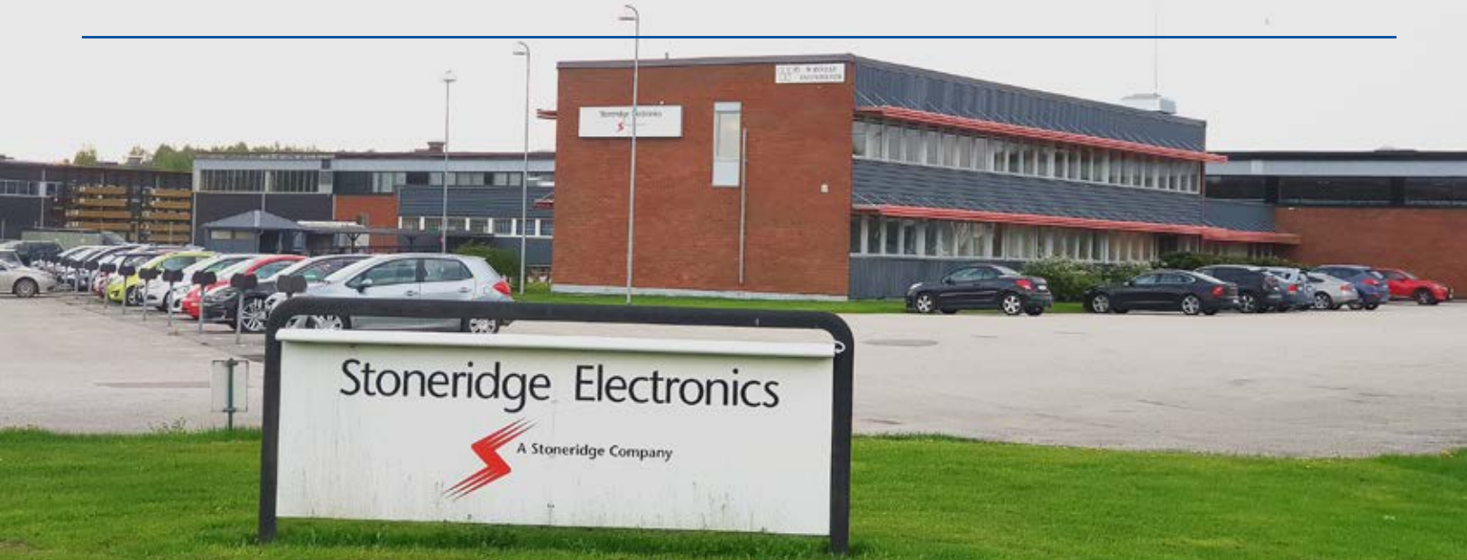
Örebrofabriken sett utifrån, vid Aspholmen.

Stoneridge Electronics är ett elektronikföretag som sedan 2003 håller till på Aspholmen i Örebro. Där tillverkas instrumentpaneler och digitala färdskrivare för diverse lastbilsfabrikat.