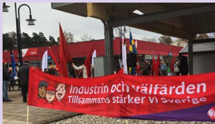
I Laxå samlades det till torgmöte.