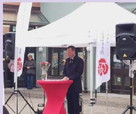
Anders Ygeman talar i Lindesberg.