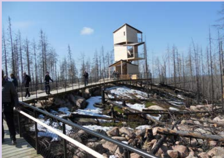
Sten som kom fram när jorden försvann. Detta bredvid rampen till tornet.

Största problemet när branden bröt ut var att det inte fanns ett helhetstänk över brandbekämpningen. Det började brinna i en kommun som släckte inom sitt område. Att det brann i grannkommunen var inte deras problem. Det utvecklades en brand som omfattade 14 hektar (cirka 1 x 1,5 mil), med 9 släckningsledare som styrde över var sitt område. Till slut tog länsstyrelsen över, 12 helikoptrar och 4 flygplan deltog i släckningen. Samtliga brandkårer och ett stort antal bönder som tömde sina gödselspridare och fyllde dem med vatten gjorde en stor insats. Det fick hela bygden att ställa upp efter