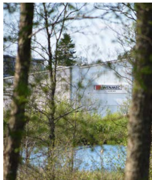
På ESAB området ligger Wenmec i Laxå AB (tidigare Witte Pemax AB).