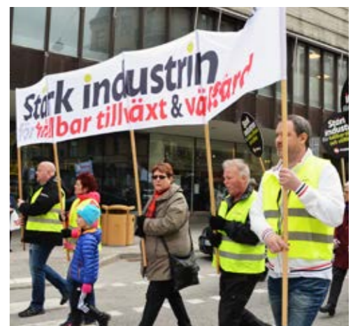
Demonstrationståget på march i Örebro.