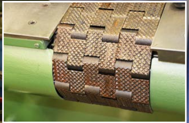
Matarmattan i närbild när den är på plats i lamellsågen.