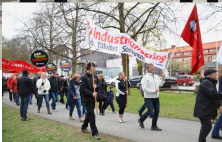
IF Metallare i demonstrationståget i Örebro.