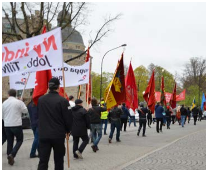
Tåget passerar Örebro slott på väg till mötet på Stortorget.