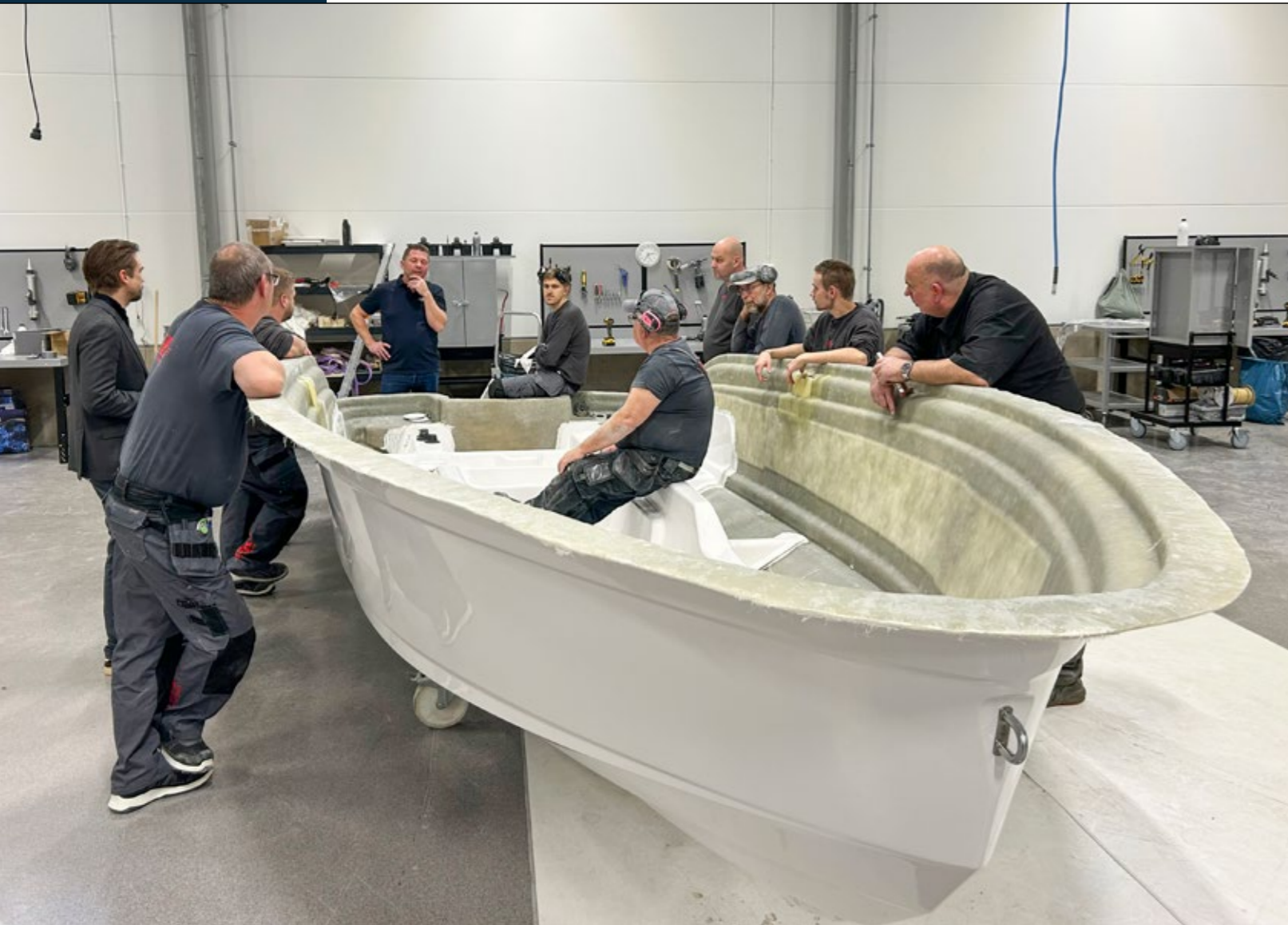
En stor del av gänget som arbetar på HR Boat.