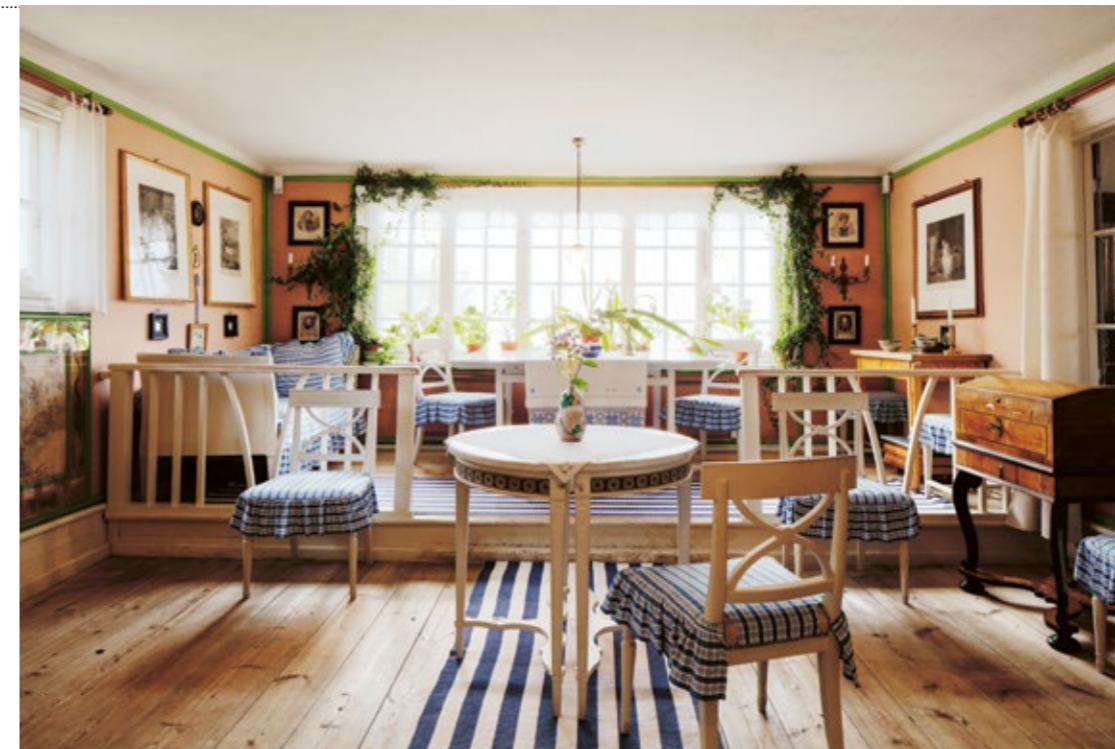
Carl Larsson-gården, förmaket.