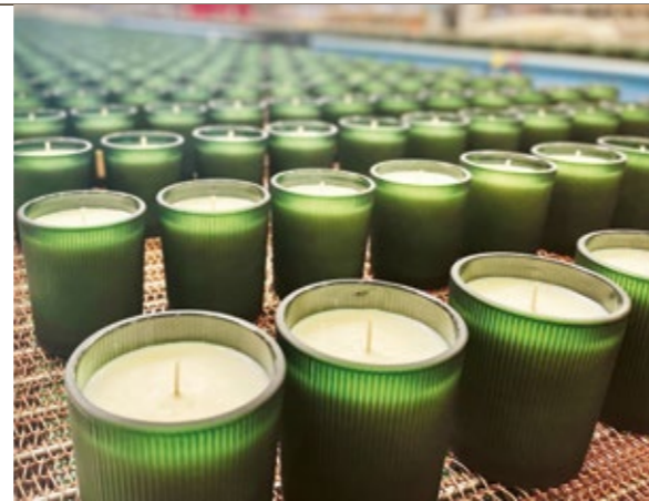
Härlig produktionsbild från bandet.