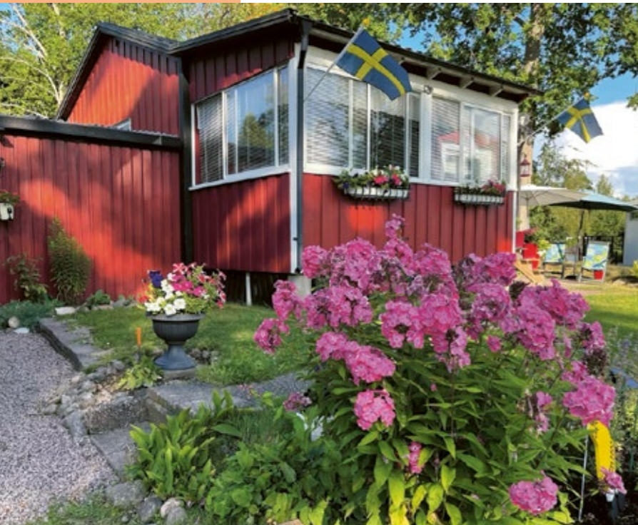
Här ses sommarstugan som är Connyns favoritställe där han gärna spenderar mycket av sin lediga tid.