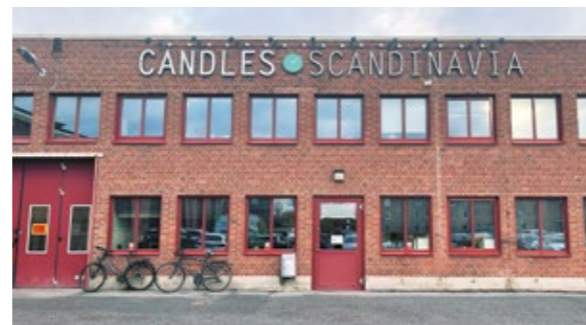
Candles ligger i dag på CV-området i Örebro.