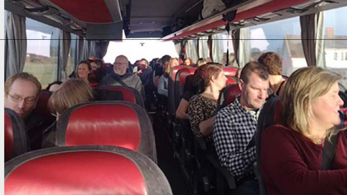
Solig bild ifrån bussen med ett förväntansfullt gäng på väg mot Göteborg