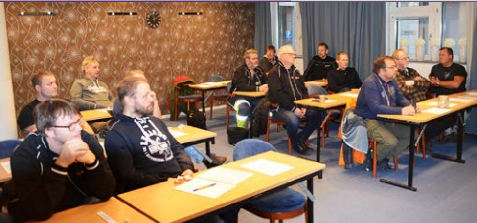
Många bra diskussioner blev det på dagens träff. Alla bidrog med sina erfarenheter och delade gärna med sig.