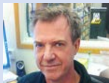
Sverker Törnvall Eriksson Bil AB - Jag tror att det blir klart.

Hur har det gått i årets löneförhandlingar?