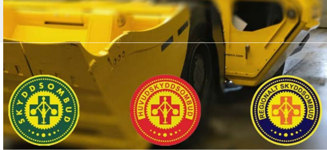
De tre märkena som skyddsombud har, beroende på uppdrag.

fler än 50 anställda. Regionala skyddsombud fungerar som en stöttande funktion på mindre arbetsplatser till de lokala skyddsombuden eller på arbetsplatser där skyddsombud inte finns.