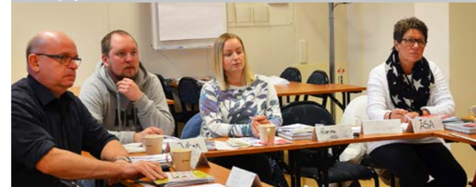
Engagemanget var på topp när kursen Vald på jobbet pågick under tre dagar i februari.