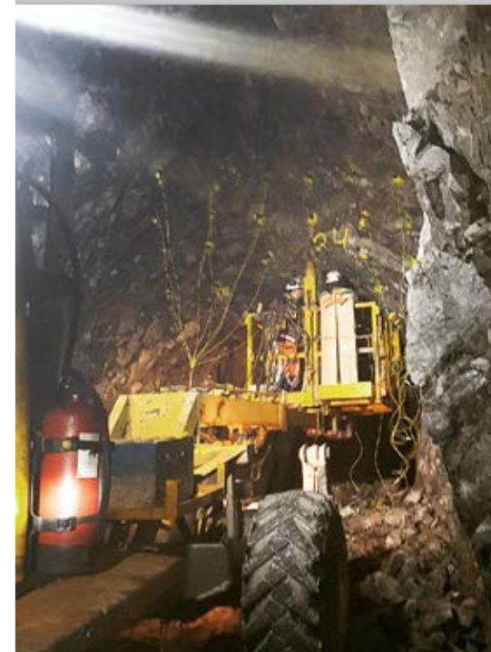
En lite annorlunda dag för våra regionala skyddsombud vid en skyddsronder i Lovisagravan.