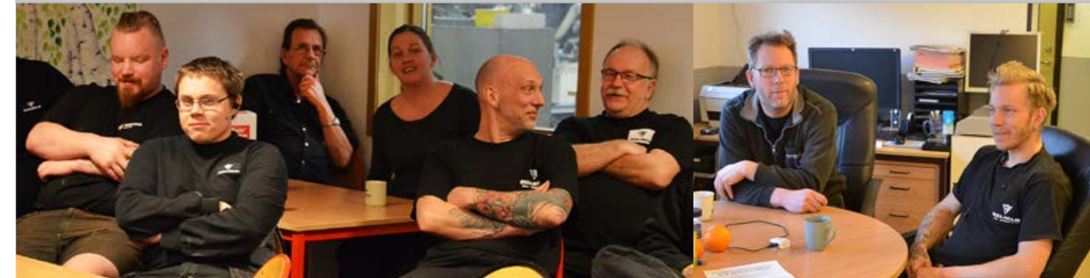
MEMLEMSMÖTEN PÅ ROBUSTUS WEAR COMPONENTS AB I ÖREBRO OCH PÅLSBODA. Avtalsrörelsen låg i fokus när IF Metall Örebro län var ute under aktivitetsveckan.