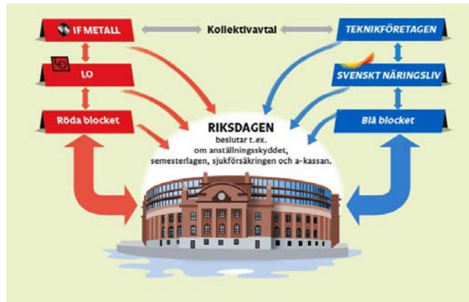
En karta på hur samverkan mellan alla parter fungerar i riksdagen.

Arbetet i kommittén handlar också om att anordna kurser för att öka förståelsen och ge verktyg till att själv kunna påverka och bli engagerad. Att delta och göra IF Metall röst hörd och försöka påverka makthavare om våra behov är en annan del i kommitténs arbete.