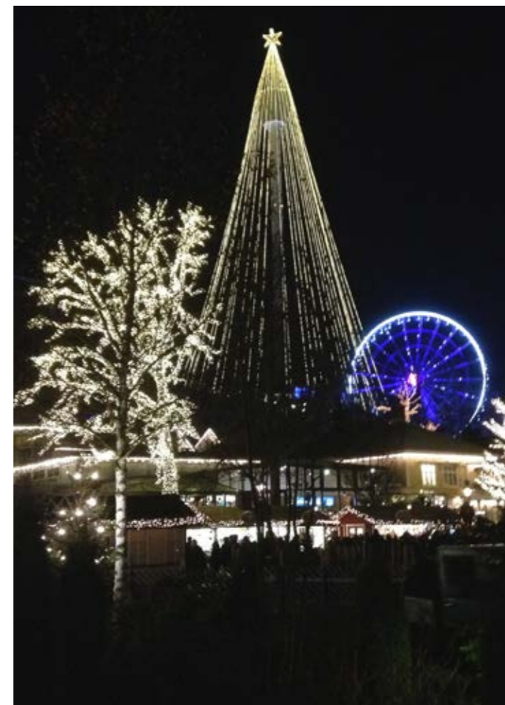
Härlig kvällsbild med många av alla lampor som dekorerar åkattraktionerna.

Text: Stefan Johansson