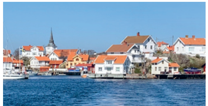
▲ På Gullholmen har IF Metall flera stugor som man kan hyra till bra priser. Fler stugor att hyra på andra platser hittar man i IF Metall's fritidsguide som finns på hemsidan.

BEFOLKNINGSÖKNING: Invånarantalet i Sverige når för första gången över sex miljoner.