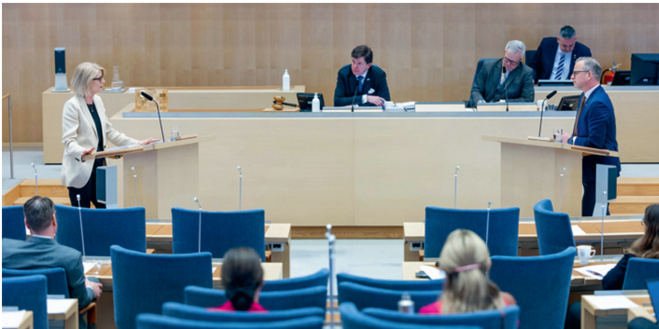
▲ Riksdagsdebatten om regeringens budgetproposition i våras.