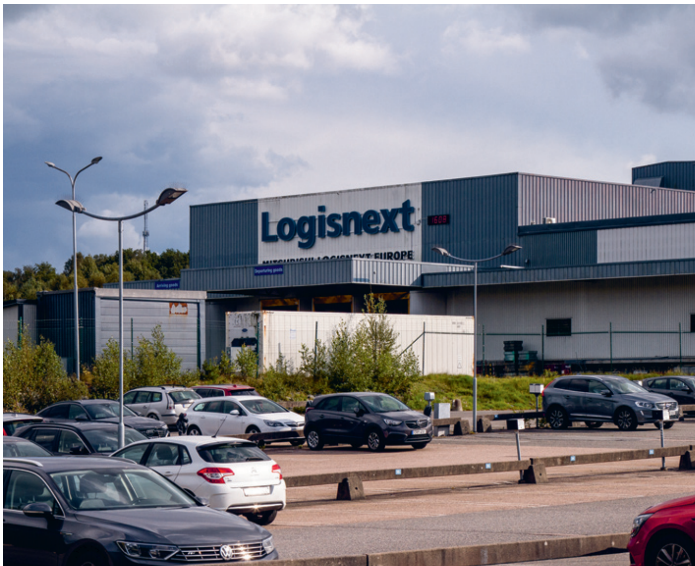
▲ Produktionen vid Logisnext anläggning i Mölnlycke flyttas till Finland.