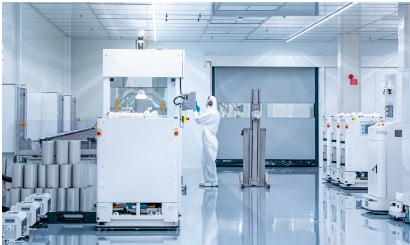
▲ Produktionsbild från Northvolts anläggning i Skellefteå.