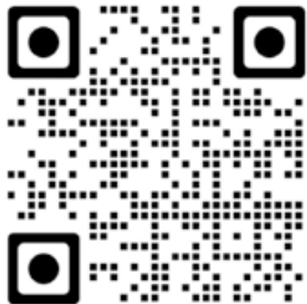
Göteborgs arbetares folkhögskola (GAF)

Förbundets hemsida där du hittar senaste nytt och information om de olika verksamhetsområdena inklusive studier.