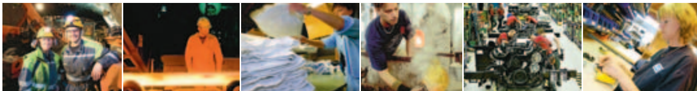
Vi är med. Gruvarbetare, stålverksarbetare, tvätteriarbetare, glasblåsare, bilarbetare och montörer är medlemmar i IF Metall.

alla vardagar 8.15–16.45. Även arbetsgivare och föräldrar ringer och ställer frågor. Ingen fråga är för liten eller för konstig att ställa.