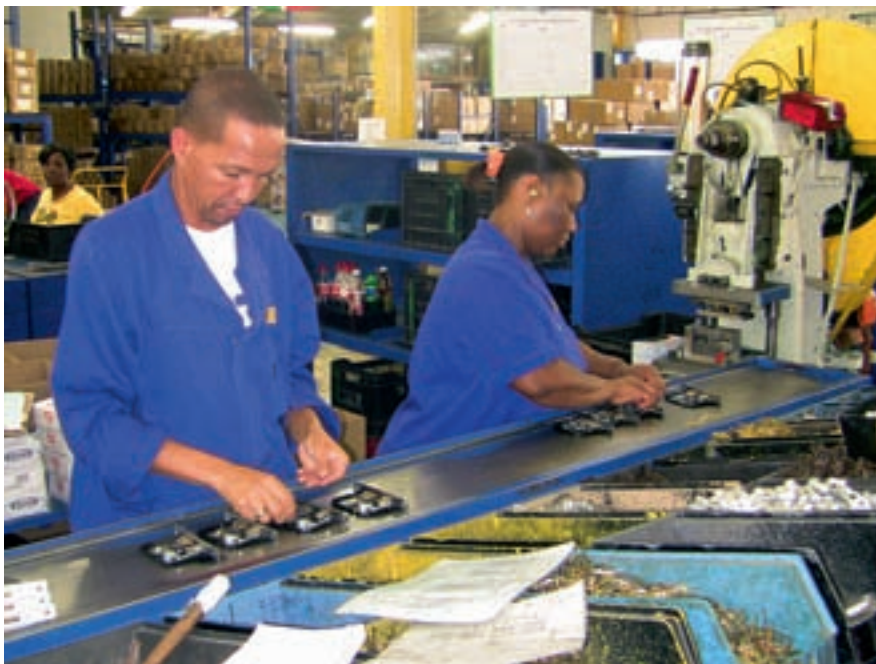
FACKLIG GLOBALISERING. – Facket måste ta en ledande roll för social och facklig rättvisa utanför våra egna gränser. Företagen har globaliserat sig – det måste vi också