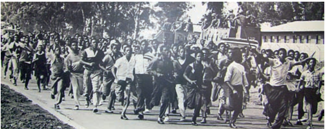
KÅKSTADEN SOWETO är både en plats och symbol för kampen mot apartheid i Sydafrika.