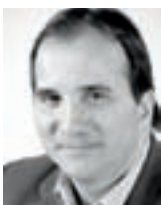
Stefan Löfven Förbundsordförande i IF Metall

Avtalet är IF Metalls sätt att dra sitt strå till stacken för att minska ungdomsarbetslösheten. Vi har gjort något konkret till skillnad från dem som bara snackar!