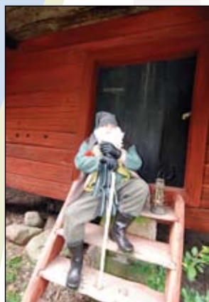
Text & Foto Tommy Pettersson