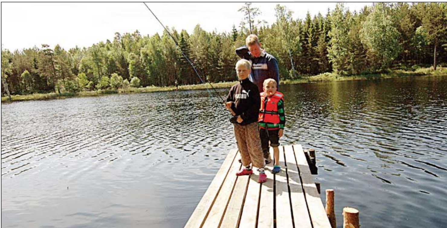
Gäddgölen ingår i det fiskevårdsområde som IF Metall sköter om.