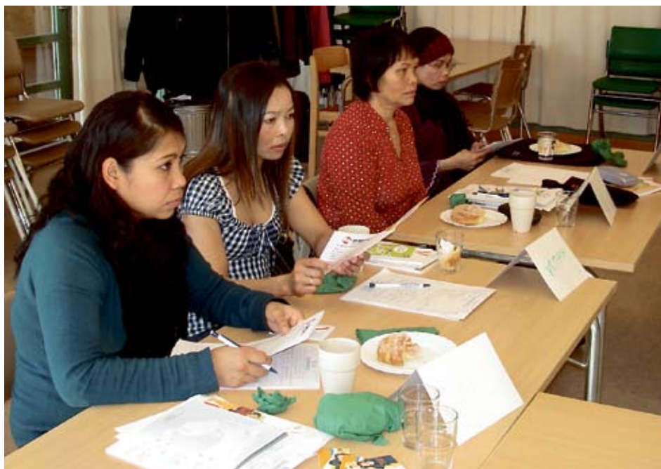
Intresset och engagemanget var stort bland deltagarna.